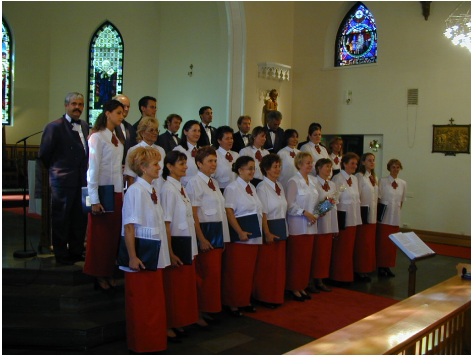
Konsertti Pyhän Henrikin kirkossa, missä tätä ennen kuoro osallistui messuun